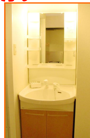
シャワー・ドレッサー