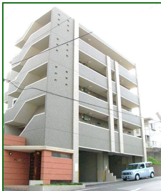
ディンプルキー&TVドアホンで安心♪