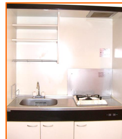
キッチン1口ガスコンロ